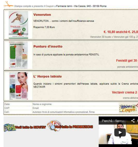
Coupon del Fornitore Affiliante con Video, Promozioni, Novità