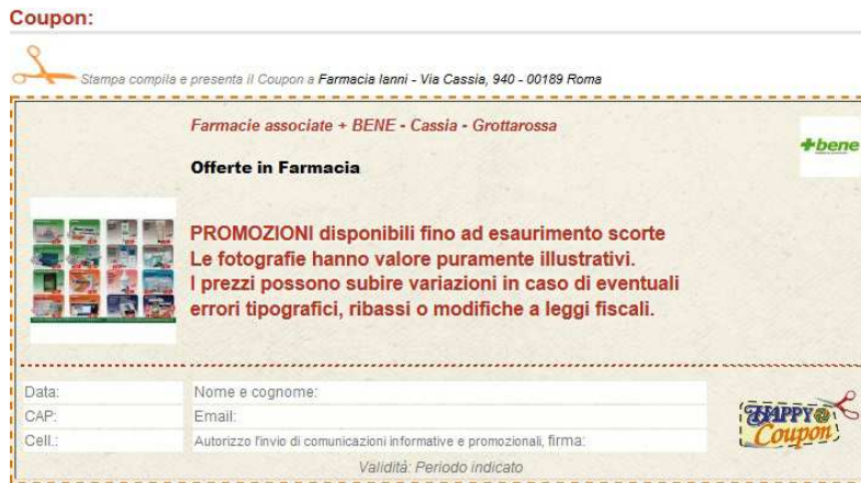
Coupon pubblicato dalla stessa Attività